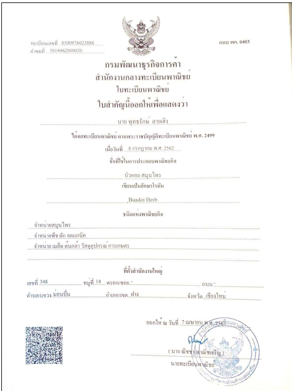
ภาพที่ ข.1 ใบทะเบียนพาณิชย์ประกอบกิจการ ของกิจการบ้านบัวค้อย